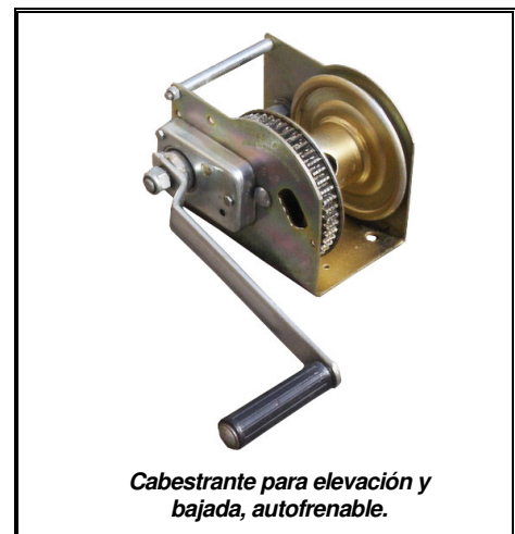
Cabestrante para elevación y bajada, autofrenable.